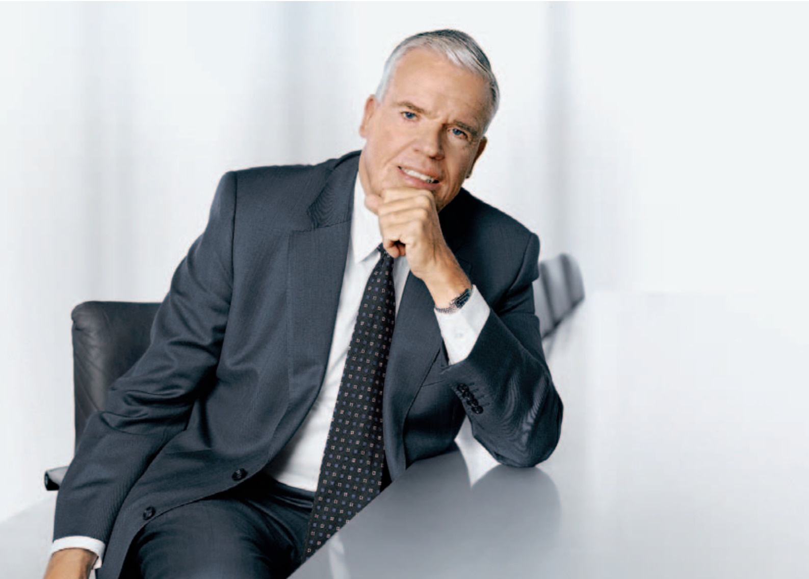
KLAUS-MICHAEL KÜHNE - Präsident des Verwaltungsrats der Kühne + Nagel International AG