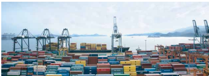
Atemlose Globalisierung: Container stapeln sich im Hafen.

Ihre Gleichung ist korrekt: Mehr Transport bedeutet mehr Umweltbelastung. Das größte Problem bieten die Camions. Obwohl sich strengere Umweltstandards mehr und mehr durchsetzen, ist meine Haltung klar: Es wird viel zu viel auf der Straße transportiert. Das Problem ist, dass die Bahnen vorrangig den Passagierverkehr fördern, die Fracht muss warten, zudem verfolgt jede Bahn in Europa ihre eigene Politik. Der Ausbau der Bahnkapazitäten ist langwierig, auch wegen der gewaltigen Investitionen. Aber er muss sein. Doch man darf sich keine Illusionen